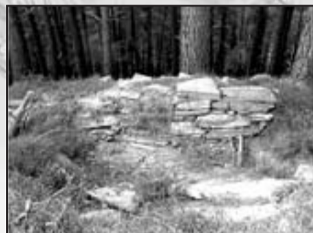
San Pedro de Goikuria. Parapeto de piedras