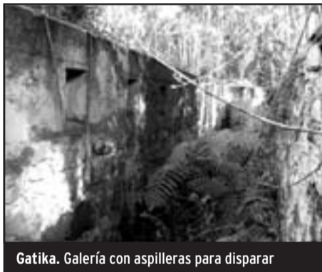
Gatika. Galería con aspilleras para disparar