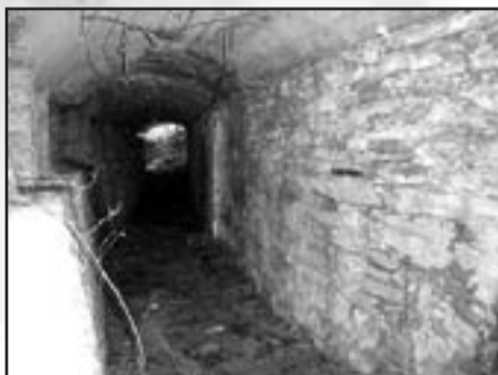
Loroño. Galería fortificada con nido de ametralladoras