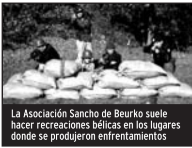
La Asociación Sancho de Beurko suele hacer recreaciones bélicas en los lugares donde se produjeron enfrentamientos

Ambos bandos contaban con unos 40.000 hombres , pero en armamento el bando republicano era muy inferior al de los nacionales, que además contó con la ayuda de alemanes e italianos