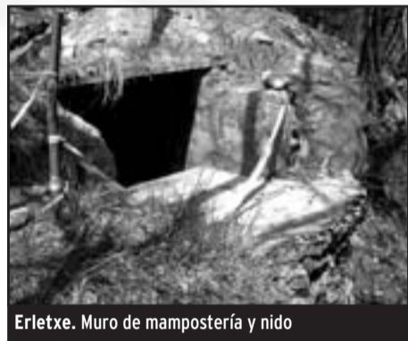
Erlatxe. Muro de mampostería y nido